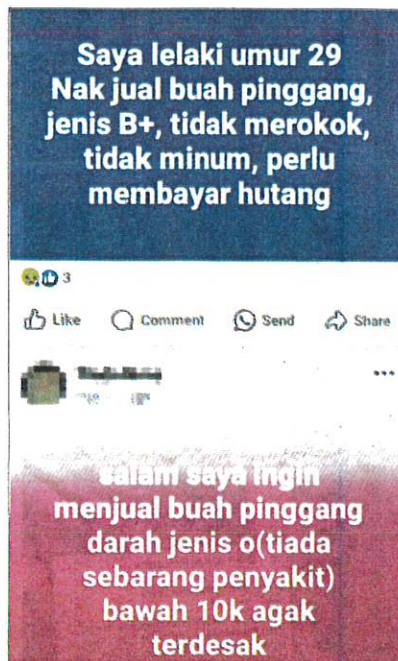
ANTARA tangkap layar diambil di Facebook menunjukkan pihak yang mahu menjual buah pinggang untuk mendapatkan wang bagi membayar hutang. - GAMBAR HIASAN

jika buah pinggangnya tidak laku, dia rela menjual matanya asalkan tidak kehilangan isteri dan anak-anaknya.