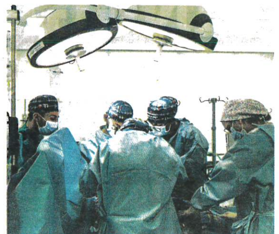
PEMINDAHAN organ perlu menjalani prosedur tertentu bagi mengelakkan berlakunya urusan jual beli yang salah. - GAMBAR HIASAN

Tambahnya, anggota badan adalah harta yang paling bernilai dan tidak boleh diukur melalui wang ringgit.