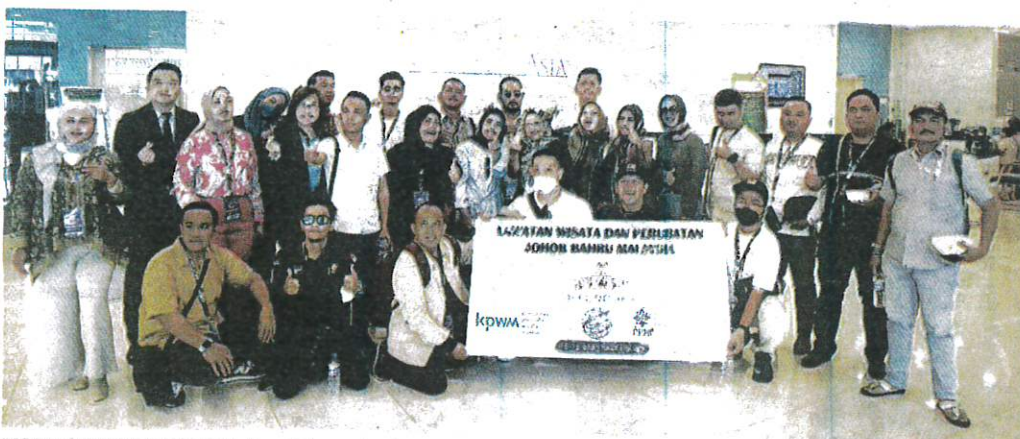
PARA pelancong kesihatan dari Indonesia bergambar kenangan di Columbia Asia Hospital Tebrau, Johor.

Ujarnya, EV-ICD mempunyai wayar yang ditempatkan di luar jantung dan salur darah.