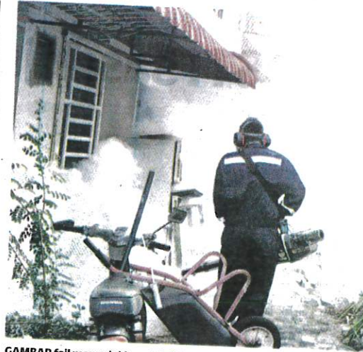
GAMBAR fail menunjukkan aktiviti penyemburan kabut dilakukan di kawasan kejiranan bagi mencegah pembiakan nyamuk.

AKHBAR : KOSMO MUKA SURAT : 6 RUANGAN : NEGARA