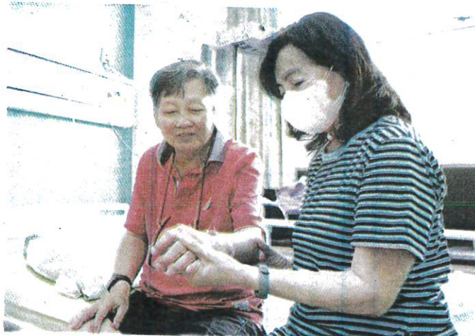
RATA-RATA pelancong kesihatan di Malaysia adalah dari negara serantau. - GAMBAR HIASAN