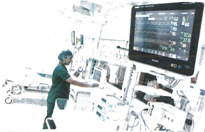
TEKNOLOGI rawatan kesihatan di negara ini antara yang terbaik di rantau Asia Tenggara.

pesakit antarabangsa di hospital itu menunjukkan peningkatan saban tahun.