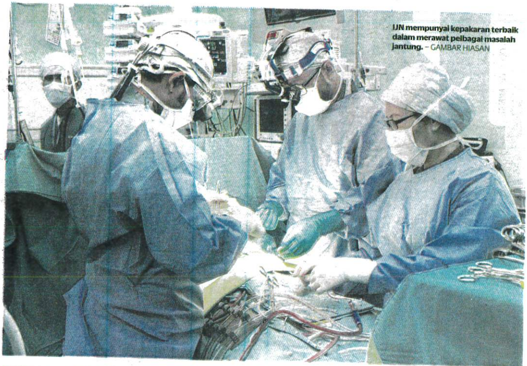
IJN mempunyai kepakaran terbaik dalam merawat pelbagai masalah jantung. - GAMBAR HIASAN